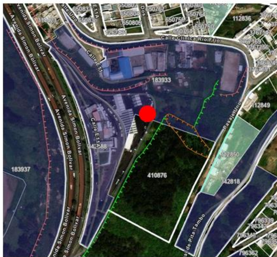
FIGURA 1 UBICACIÓN DEL CENTRO DE OPERACIONES LA FORESTAL

En ese sentido, la definición y aprobación de la ubicación de la Planta de Tratamiento de Aguas Residuales tanto para el Centro de Operaciones La Occidental y La Forestal se determinó entre, la Dirección de Maquinaria y Equipo; Gerencias de Proyectos e Infraestructura; Unidad de Servicios Generales y la Subdirección de Diseño de la Operación y Gestión Ambiental, siendo elegidas las siguientes opciones: