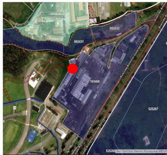
FIGURA 2 UBICACIÓN DEL CENTRO DE OPERACIONES LA OCCIDENTAL

Centro de Operaciones La Forestal: Alternativa 1. Propone situar la Planta de Tratamiento de Aguas Residuales (PTAR) en el área adyacente al Bloque de Vestidores del Centro de Operaciones La Forestal. Esta ubicación estratégica, identificada en el plano y la imagen adjuntos, ofrece un espacio que se ajusta a las dimensiones necesarias para la PTAR, que son 10 metros de longitud, 2.40 metros de ancho y 2.40 metros de altura.